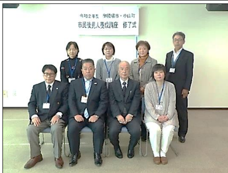
小山町の6名の参加者の皆さん