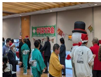
手をつなぐ育成会クリスマス会

戸別：844,950円(4519戸) 法人：250,000円(4件) 職域等：443,629円(42件) その他：181,937円