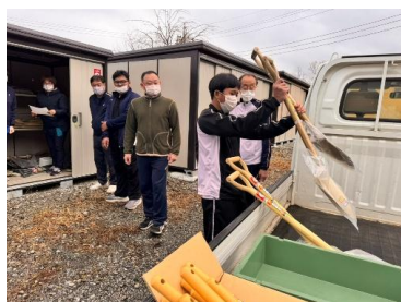
真剣に訓練に取り組む方々

本会では、赤い羽根共同募金の配分金を活用して、成美地区の平成の杜と須走地区のインマヌエル敷地内に防災倉庫を設置し、災害ボランティア活動用のスコープー輪車などの資機材を配置しています。