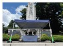
終戦平和祈願慰霊供養式 (8月15日実施)

5,568世帯の町民のみなさまからお寄せいただいた協賛金については、小山町忠霊塔の維持管理や戦没者慰霊祭の開催経費の一部に充てさせていただきました。