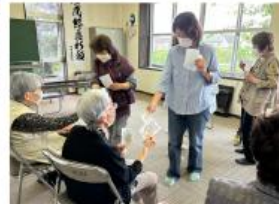
手作りジャンケンカード何枚獲得できましたか？