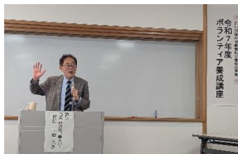
熱心に説明を行う下垣講師