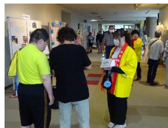
募金活動を行うボランティア等

【助成団体(順不同)】 小山町ひとり親会、町内ふれあい茶論、手をつなぐ育成会、町内放課後児童クラブ、放課後デイわかば、NPO法人おでかけクラブ