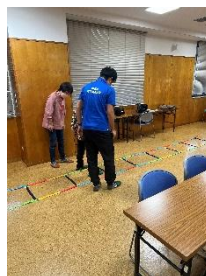
理学療法士によるラダーテスト

健康福祉会館で、健康安全運転講座を行いました。主に町内の高齢者を対象に、ダイハツ沼津販売株式会社とJAF、理学療法士の方が講師として認知機能、安全運転のポイントなどの説明や最新の車両安全装置の体験などを行いました。参加者からは、「安全運転の気づきになった。」、「安全装置の重要性が理解できた。」と好評でした。2026年も実施を計画していますので、是非ご参加下さい。