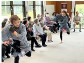
ボランティア団体の協力参加者も大笑い

成美：9人（1団体） 北郷：65人（8団体） 明倫：7人（1団体） 須走：15人（1団体） 合計：96人（11団体）