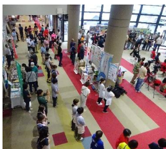
ふれあい広場（令和7年9月13日（土）開催）