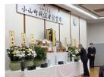
戦没者慰霊祭 (10月25日実施)