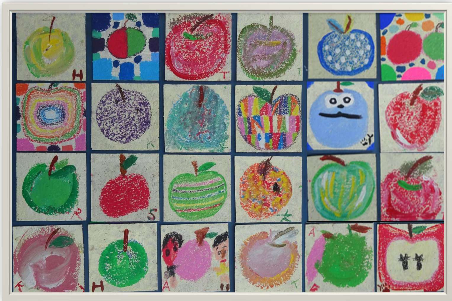
就労継続支援B型ワークホーム・アップル利用者さんの共同作品