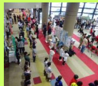
小山町ふれあい広場